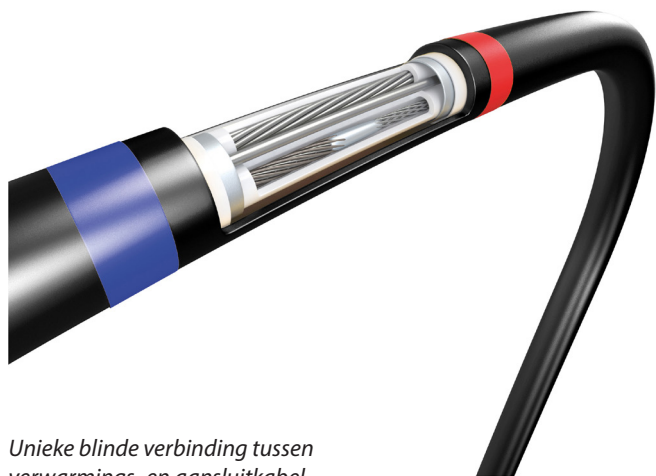
Unieke blinde verbinding tussen verwarmings- en aansluitkabel